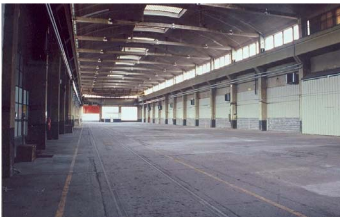
Le grand hall vu depuis le fond du bâtiment.

Les deux ponts-roulants de 10 tonnes chacun, situés