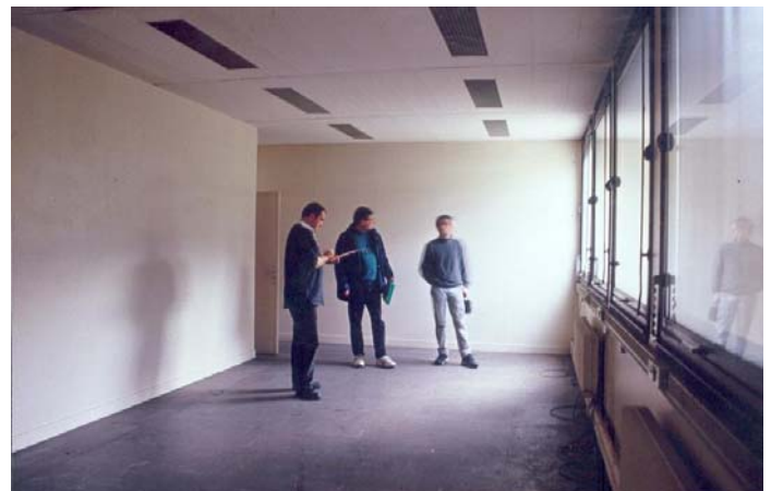
Vue partielle de la salle des archives historiques.

Pour nos besoins administratifs, nous avons demandé la jouissance de six bureaux, qui devraient être protégés par des barreaux et l'idéal serait de pouvoir murer les vitres de la salle des archives historiques. Notre association prendra à sa charge un système de protection-radar avec sirène et alerte téléphonique.