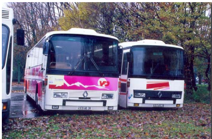
Le car choisi (n°661) est sur la gauche. A droite, le n°656 qui a été revendu à un récupérateur.

Toute notre reconnaissance va au Conseil d'Administration des VFD et à son équipe de Direction.